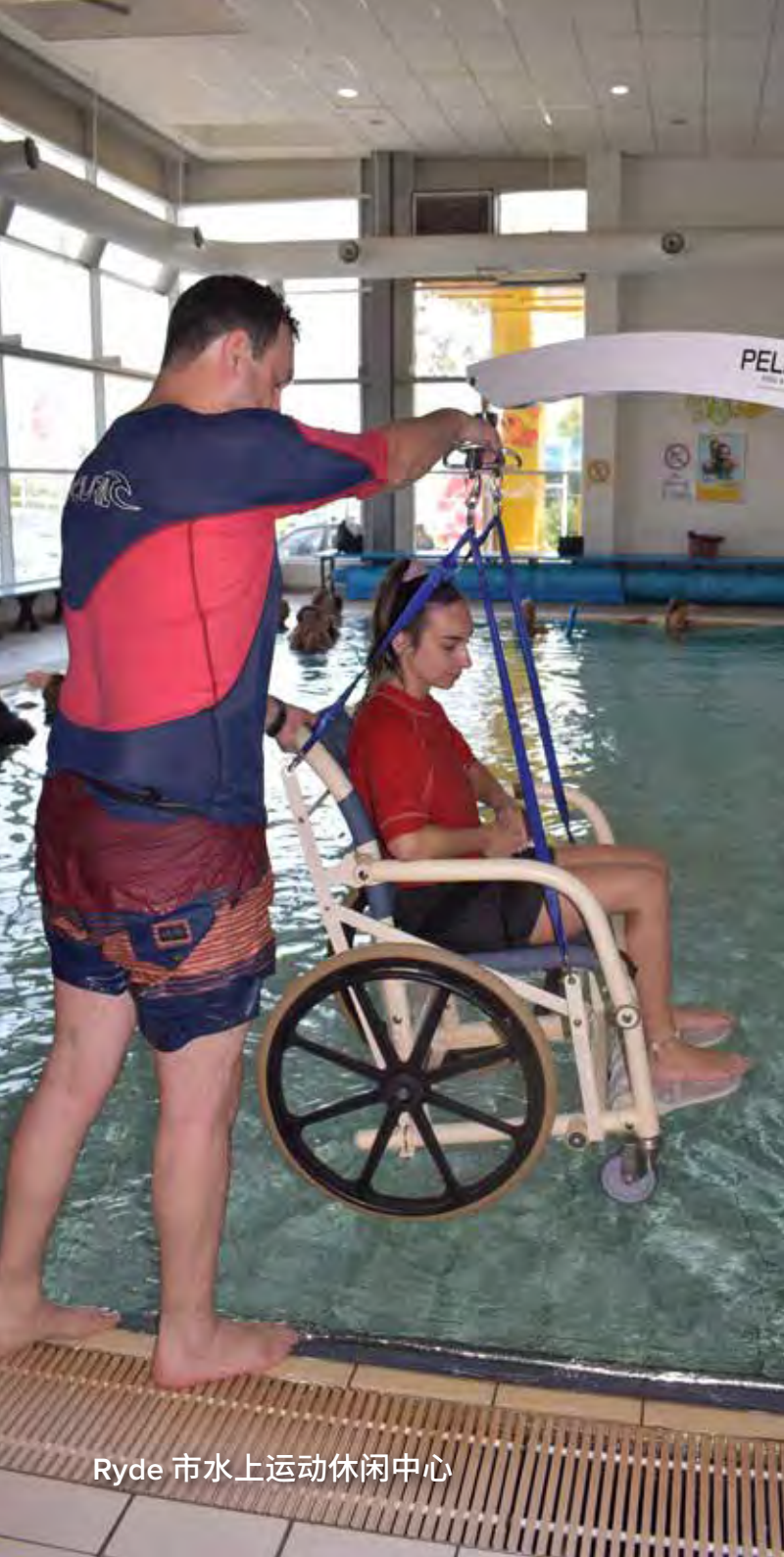
Ryde 市水上运动休闲中心