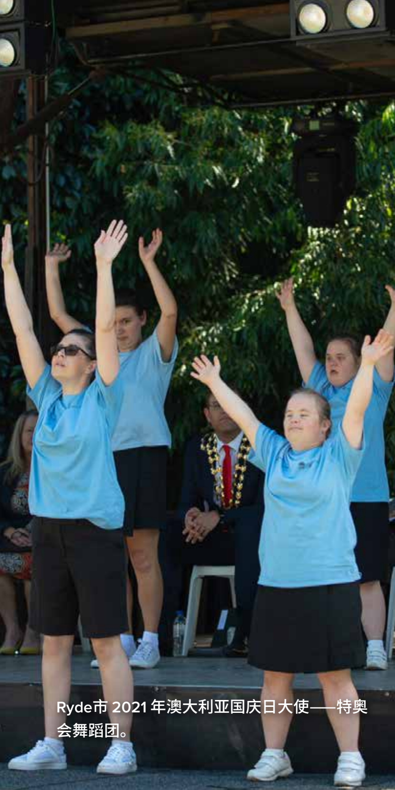
Ryde市 2021年澳大利亚国庆日大使——特奥会舞蹈团。