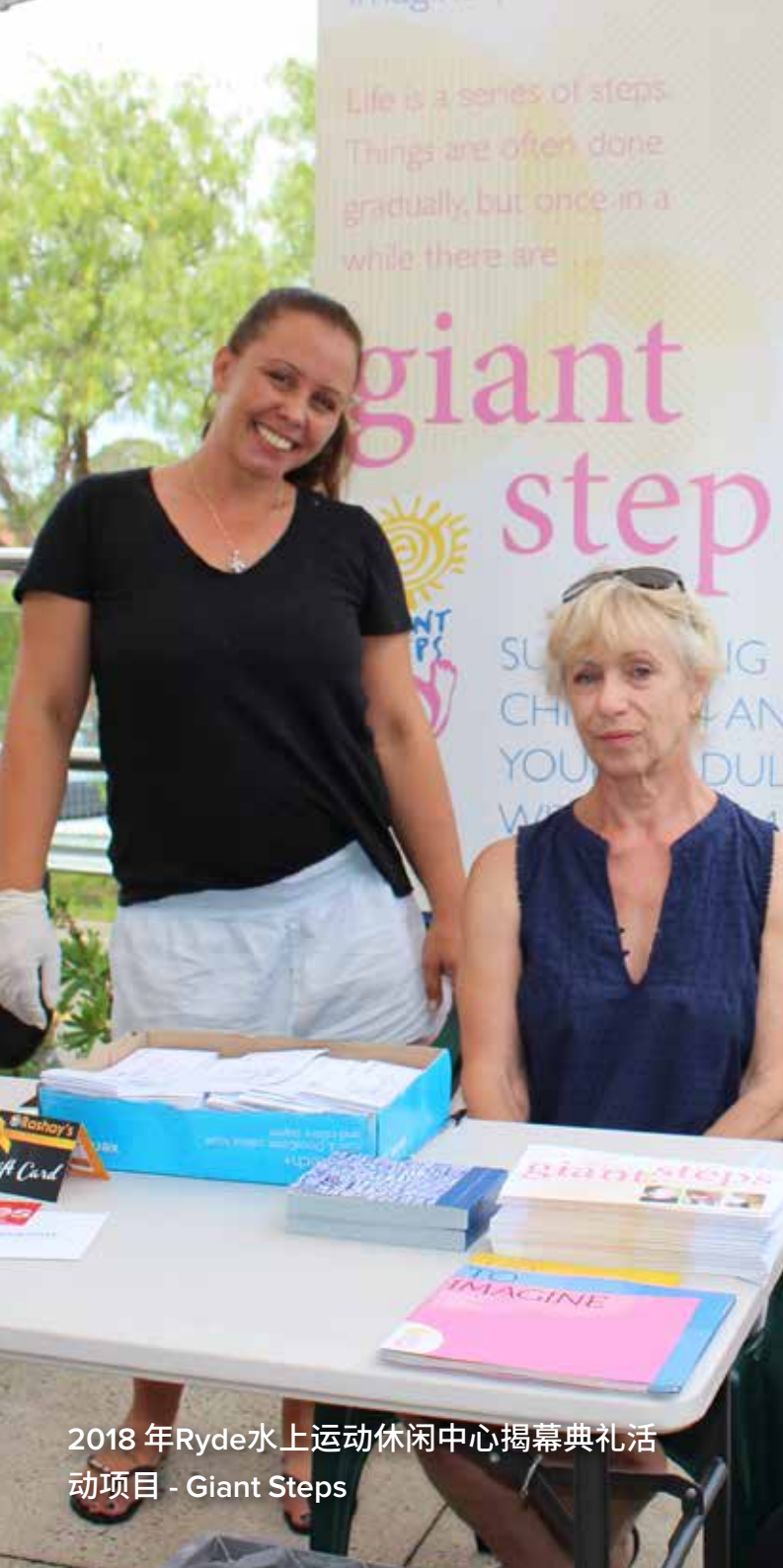
2018年Ryde水上运动休闲中心揭幕典礼活动项目 - Giant Steps