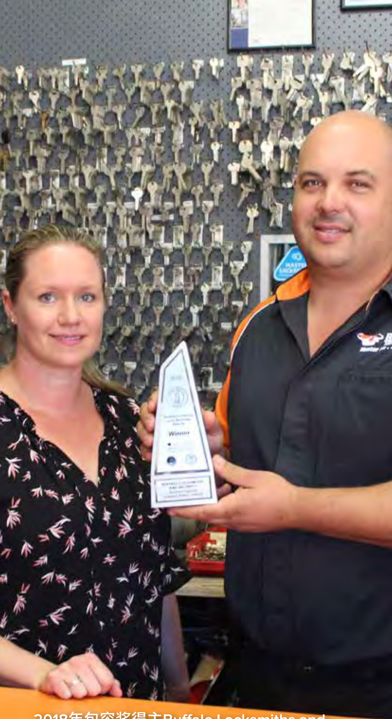
2018年包容奖得主Buffalo Locksmiths and Security 安保设施服务公司