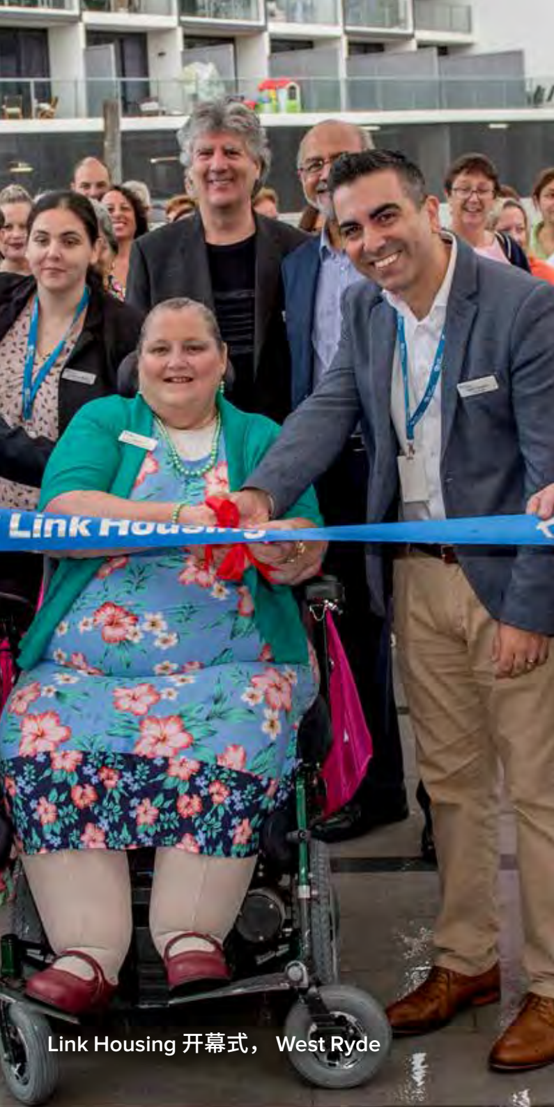
Link Housing 开幕式， West Ryde