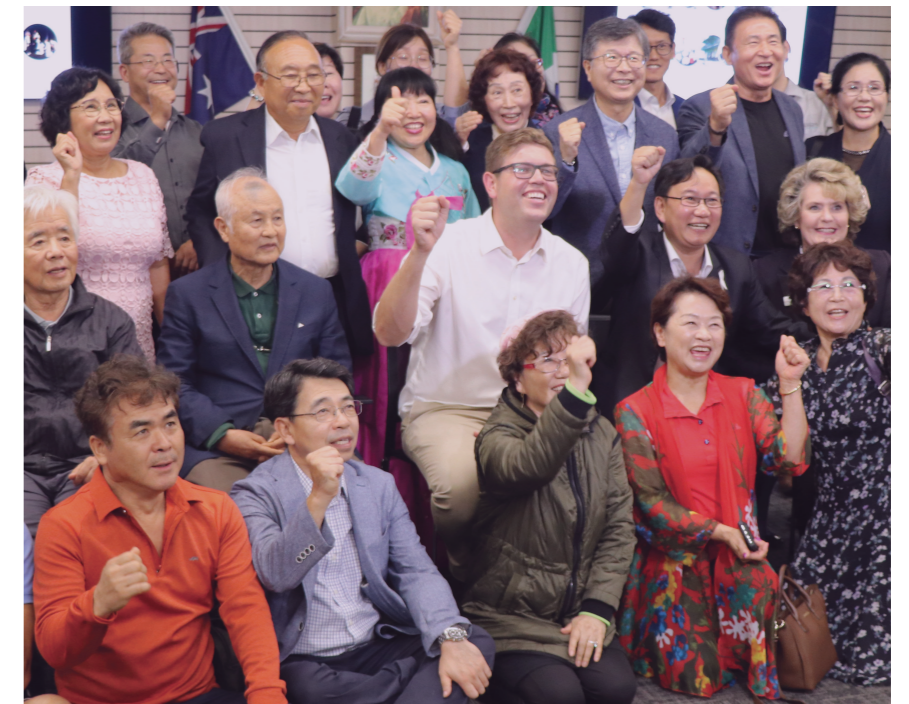
창조성 전략과 사회 계획을 위한 지역사회 협의