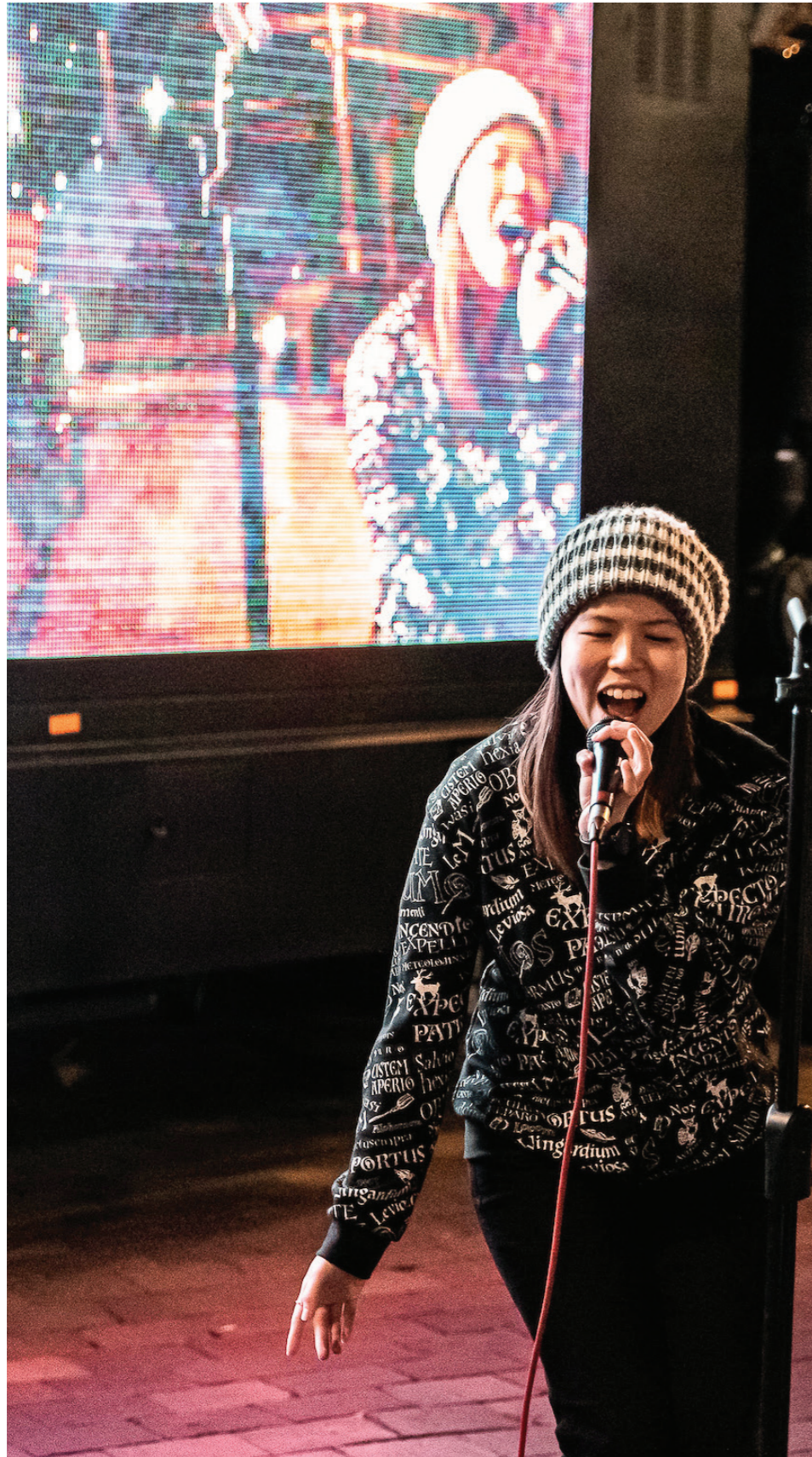
가라오케 광장.

1,100여명이 City of Ryde 창조성 전략 개발에 공헌하였습니다. 창조성 전략은 시의회와 지역사회, 협력자들이 향후 5년에 걸쳐 우리 시의 예술과 창조성을 지원하고 구축하며 강화하기 위한 공동의 비전과 전략적 로드맵을 개괄합니다.